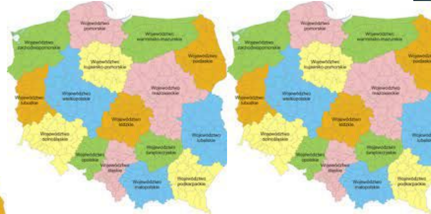
Obszaru 3 krajów Polski?