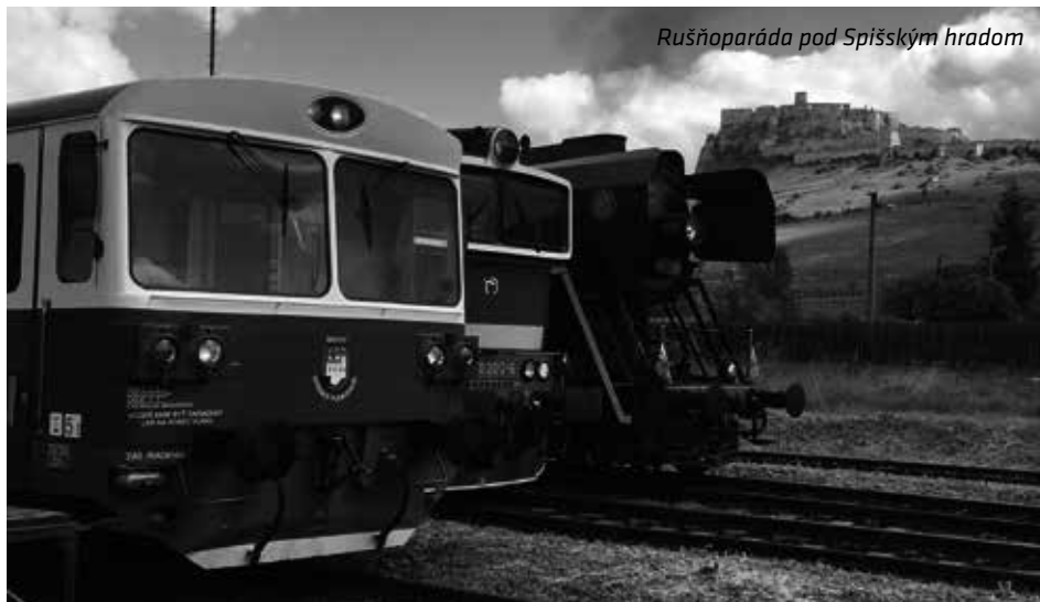
Rušňoparáda pod Spišským hradom