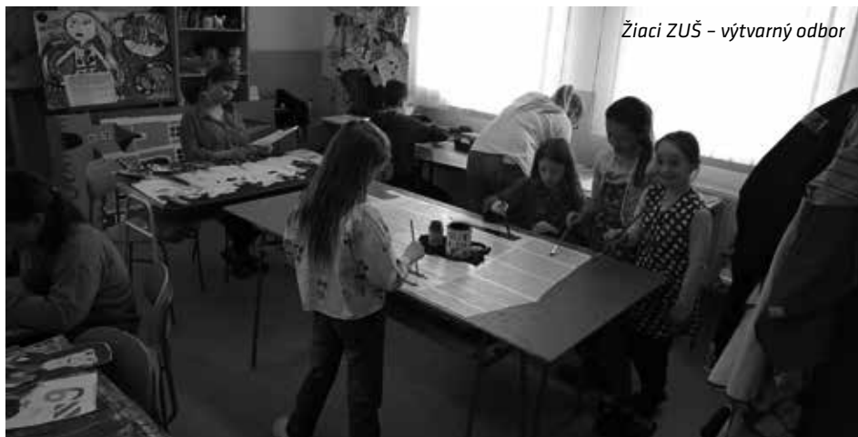
Žiaci ZUŠ - výtvarný odbor